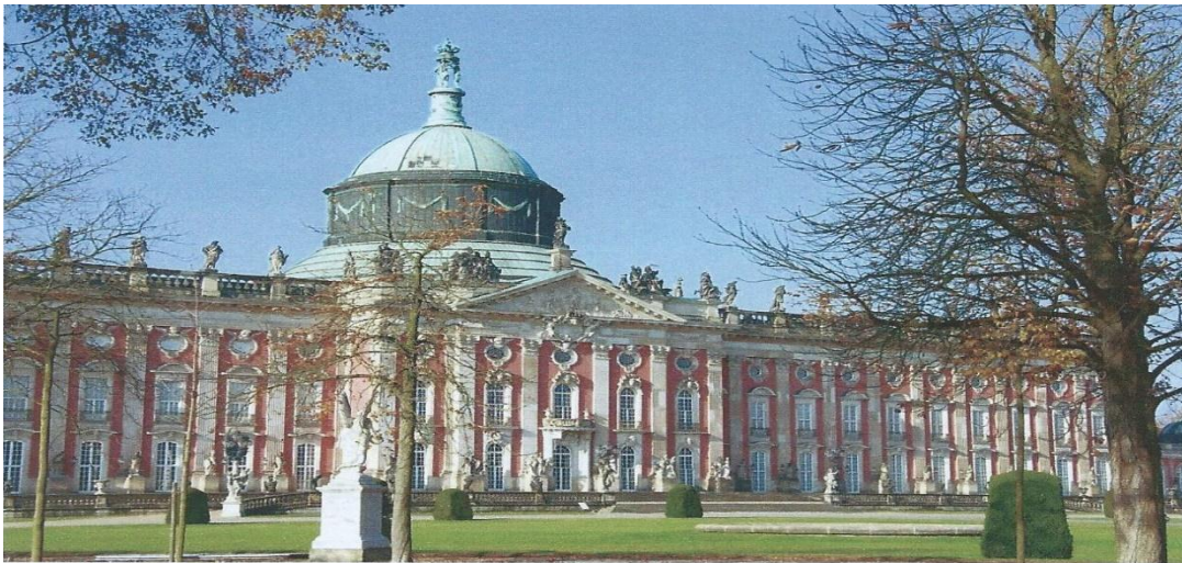
Le château de Sans Souci