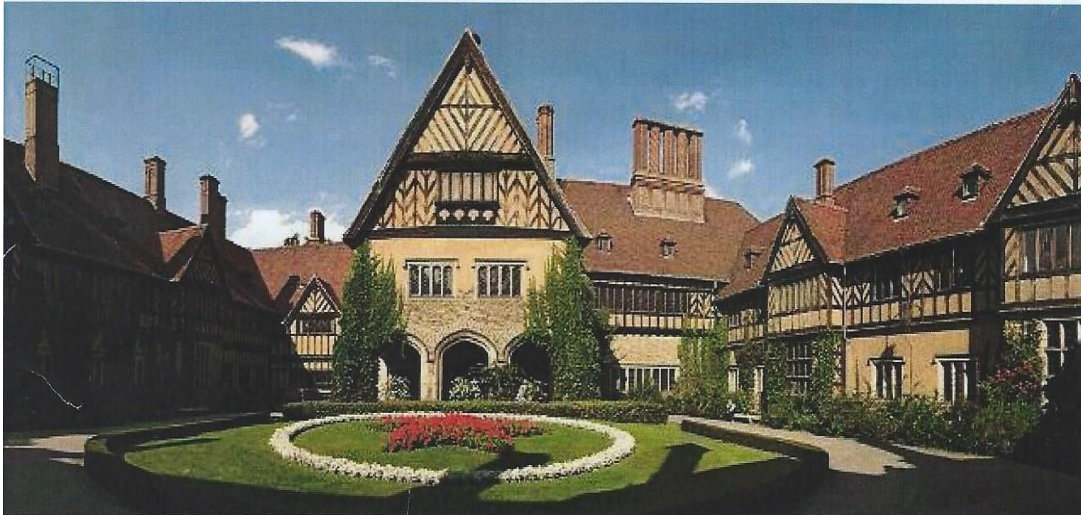
Le Château de Cecilienhof à Postdam

Départ pour POTSDAM , visite du centre ville et de son château, le Sans-Souci .Déjeuner à bord d'un bateau . Promenade dans le parc du Château de Cecilienhof (connu pour avoir été le siège de la conférence de Potsdam)