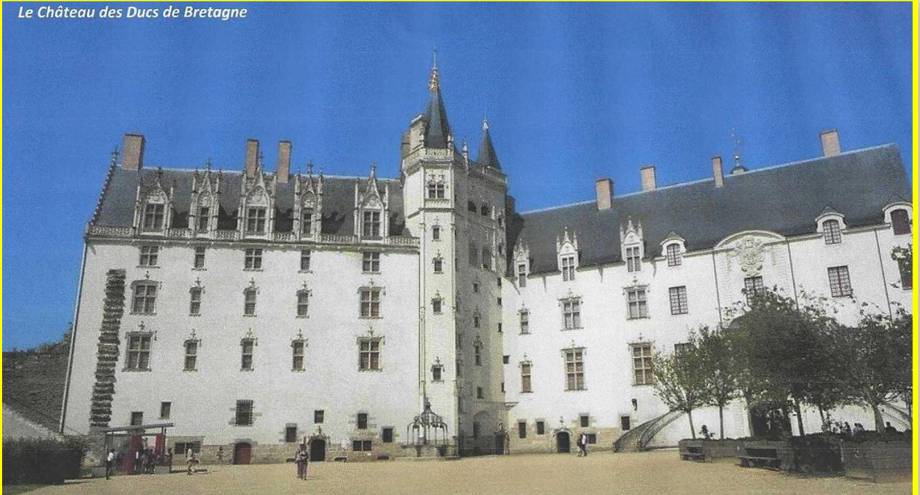
Le Château des Ducs de Bretagne