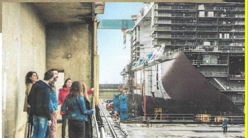
Visite des chantiers navals de Saint Nazaire